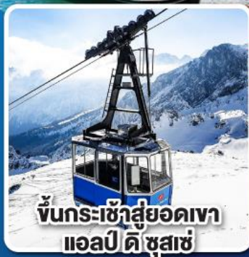
ขึ้นกระเช้าสู่ยอดเขา แอลป์ ดี ซูสเซ่

เที่ยวเมืองอินส์บรุค เพชรเม็ดงามสุดโรแมนติก แห่งแคว้นทิโรล