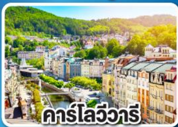
คาร์ลส์บัท